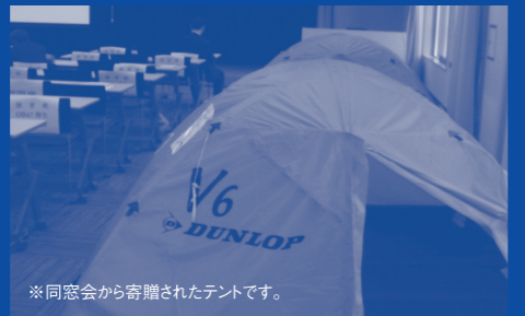
※同窓会から寄贈されたテントです。