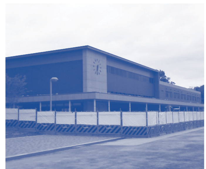
新しいクラブハウス棟には、同窓会室が入ります。

常翔啓光学園2階会議室にて総会を行います。必ず守衛さんのいる正門にて受付を済ませてからお入りください。クールビズでお越しください。