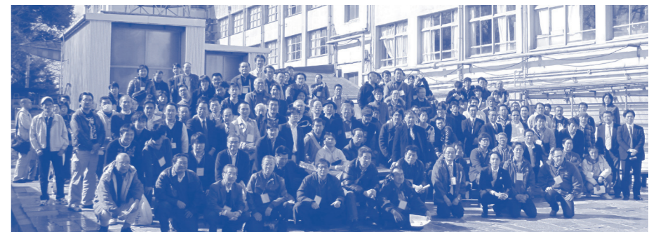
校舎お別れ会写真 H23.3.13

3月13日のお別れ会では、200名余の方にご参加いただき、ありがとうございました。素敵な演奏をしていただきました音楽部OB会様ありがとうございます。